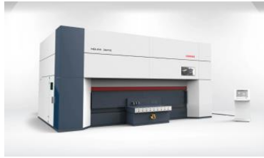
HD-FA 5-akselinen kuitulaser