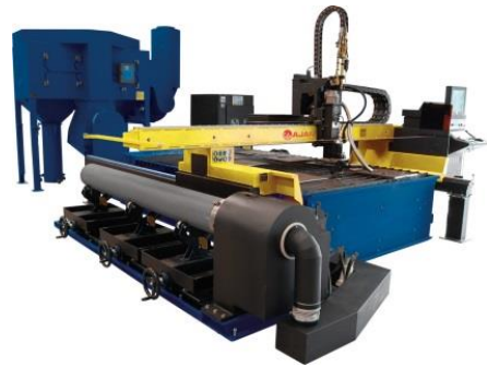
AJAN Yhdistetty putki- ja levyleikkaus

Klikkaa tuotteenkuvalla ja katsotarkemmin nordcity.fi