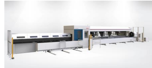
HD-TC putki ja profiili laser

Klikkaa tuotteenkuvalla ja katsotarkemmin nordcity.fi